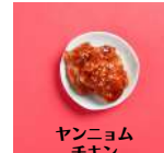
ヤンニョム チキン