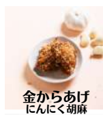
金からあげ にんにく胡麻