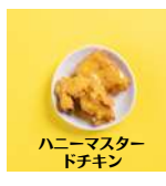
ハニーマスター ドチキン

・約2個 320円 ・約4個 640円 ・約6個 960円 ・約8 1280円 ・約10個 1550円 ・約12個 1820円 ・約14個 2090円 ・約16個 2360円