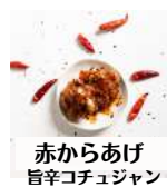
赤からあげ 旨辛コチュジャン